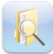
Consulter les évaluations