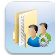
Gestion des groupes