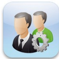
Gestion des utilisateurs