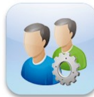
Gestion des élèves