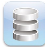
Paliers du socle