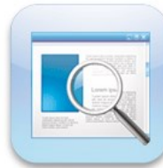
Consulter le référentiel de suivi